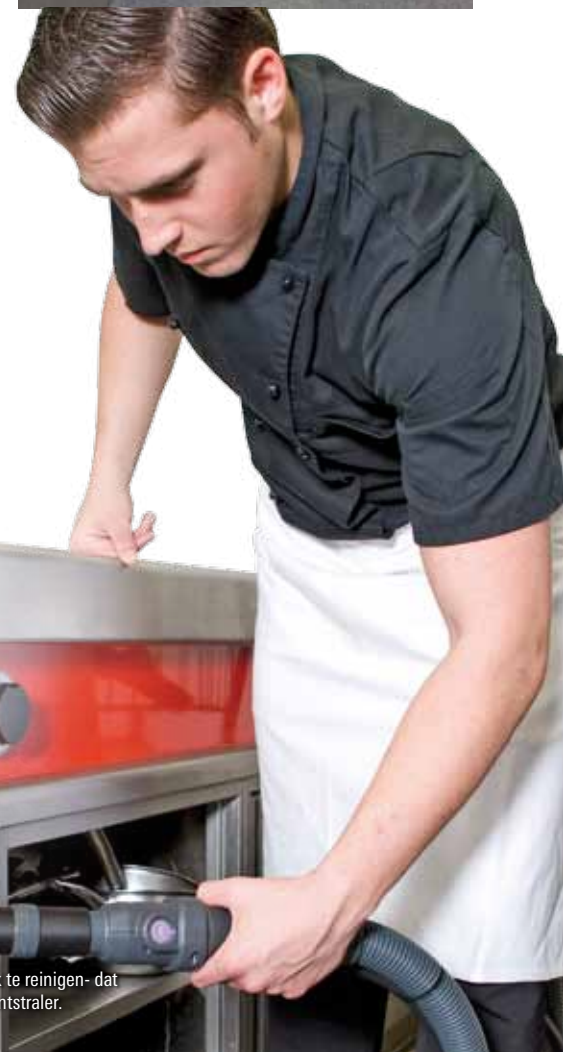
Ventilatie-roosters zijn meestal moeilijk te reinigen- dat kan nu eenvoudig met de gebogen puntstraler.