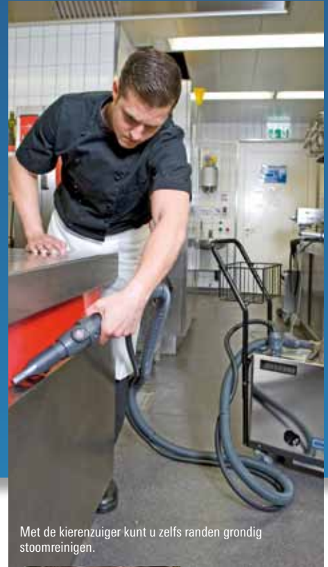
Met de kierenzuiger kunt u zelfs randen grondig stoomreinen.