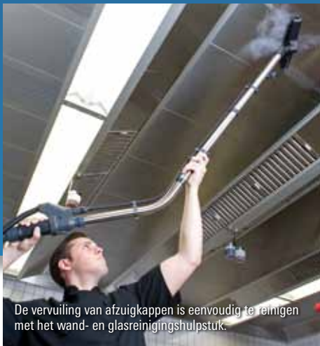
De vervuiling van afzuigkappen is eenvoudig te reinigen met het wand- en glasreinigingshulpstuk.

Op deze plaatsen is hygiënisch reinigen noodzaak! De DS 8 zorgt hier voor een perfect hygiënisch oppervlak en schoon resultaat. DS 8 is ook zeer goed inzetbaar in voedingsmidde-lenindustrie, zwembaden, kuuroorden en sportaccommodaties. Een groot voordeel van het stoomreinen van deze ruimten is dat er gereinigd wordt met een minimum aan water (=stoom) en reinigingsmiddel. Dit is ook nog eens goed voor het milieu.