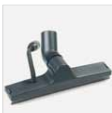
Wand- en glasreinigings- hulpstuk