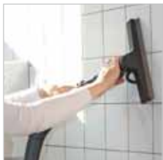
Met het wand- en glas-reinigingshulpstuk worden tegels weer als nieuw.