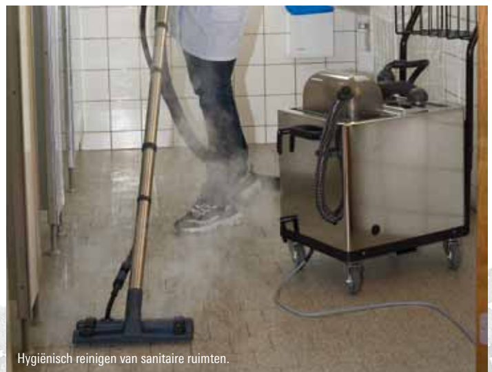
Hygiënisch reinigen van sanitaire ruimten.