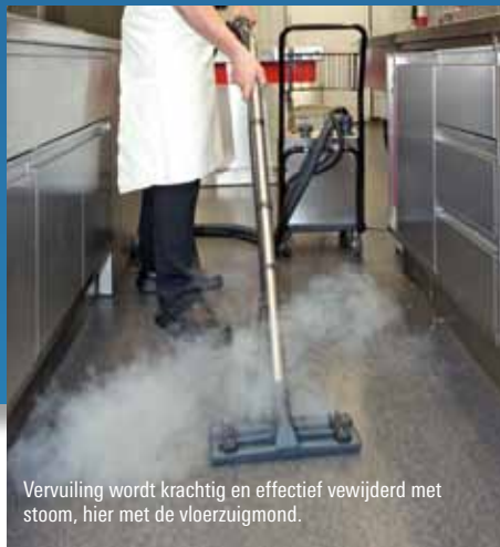
Vervuiling wordt krachtig en effectief verwijderd met stoom, hier met de vloerzuigmond.