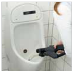
Met de gebogen puntstraler kunt u elke vervuiling bereiken.