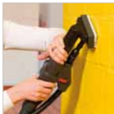
Met het kleine wandreini-gingshulpstuk is stoomreini-ging van poreuze oppervlak-ken geen probleem.