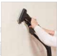
Met het kleine wandreini-gingshulpstuk kunt u ook zeer eenvoudig grove (gestucte) muren stoomreini-gen. Dankzij de borstelharen wordt alles geraakt.